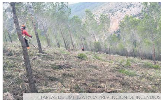
TAREAS DE LIMPIEZA PARA PREVENCIÓN DE INCENDIOS.

LAS ACTUACIONES CONTEMPLAN LAS OBRAS DE ADECUACIÓN DE LOS CAMINOS