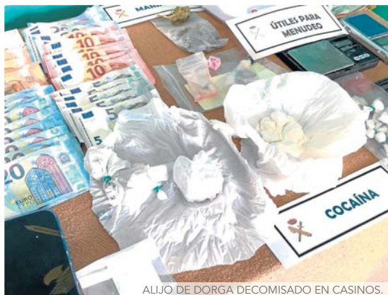
ALIJO DE DORGA DECOMISADO EN CASINOS.

Entre julio y septiembre se detectaron por parte de los inves-