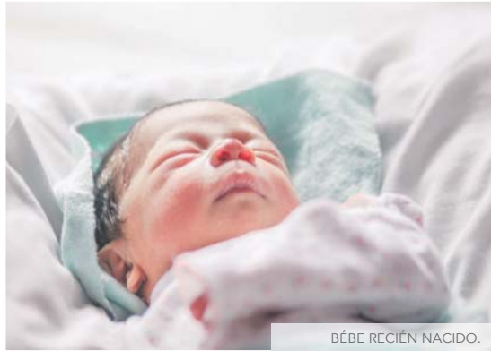
BÉBE RECIÉN NACIDO.