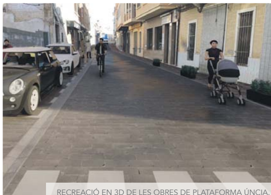
RECREACIÓ EN 3D DE LES OBRES DE PLATAFORMA ÚNICA.

ris, en la seua visita a l'inici dels treballs ha explicat que "es tracta d'una actuació per a millorar l'accessibilitat a aquests carrers que tenen una gran afluència de persones i de vehicles, donant prioritat als peatons enfront dels vehicles atés que el carrer passarà a ser d'un ús semipeatonal, reservant major espai d'ús a les