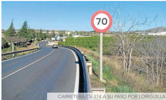
CARRETERA CV-374 A SU PASO POR LORIGUILLA.

EL PROYECTO QUE EJECUTA LA DIPUTACIÓ INCLUIRÁ UN PUENTE