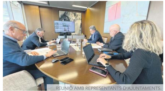
REUNIÓ AMB REPRESENTANTS D'AJUNTAMENTS.

ELS VEÏNS PODRÀN VIATJAR GRATIS EN METRO, RODALIES, METROBÚS I EMT