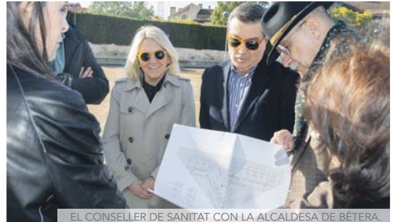
EL CONSELLER DE SANITAT CON LA ALCALDESA DE BÉTERA.

BÉTERA ABRIRÁ UN CONSULTORIO AUXILIAR JUNTO AL CENTRO CÍVICO