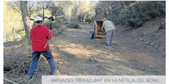
BRIGADES TREBALLANT EN LA NETEJA DEL BOSC.

HA FUNCIONAT DES DE 2022 AMB CINQ TREBALLADORS DURANT SIS MESOS