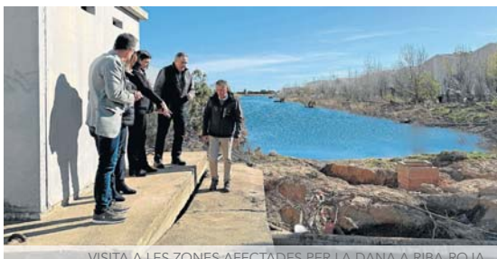
VISITA A LES ZONES AFECTADES PER LA DANA A RIBA-ROJA

L'alcalde ha mostrat la devastació patida en l'enclavament