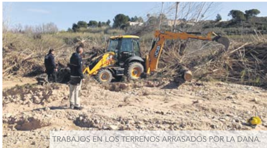
TRABAJOS EN LOS TERRENOS ARRASADOS POR LA DANA.

LA SUBVENCIÓ ES DESTINARÀ A RENOVAR TOTES LES INFRAESTRUCTURES DANYADES